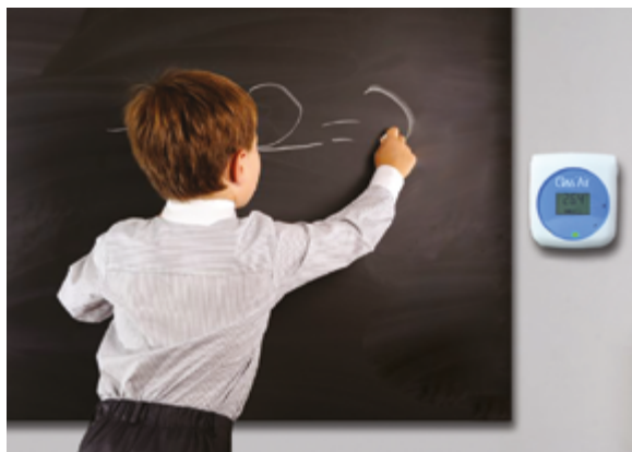
Boitier pédagogique Class'Air / PYRESCOM

Dans ta classe, la qualité de l'air peut être surveillée à l'aide de boîtiers qui mesurent